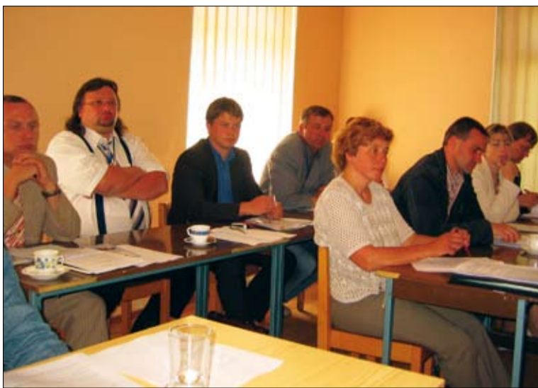
Arenduskoda reorganiseeriti LEADER tegevusgrupiks 2006. aastal.

MTÜ Arenduskoda töötajate nimekirjas on kaks põhikohaga töötajat (tegevjuht ja juhiabi) ning kaks osalise tööajaga töötajat (raamat-