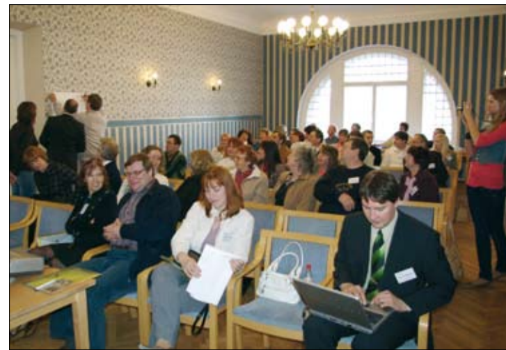
Jänelal toimunud LEADER konverentsil arutati, kuidas motiveerida ja kaasata kogukonna liikmeid koos tegutsema.

- Ettevõtluse mitmekesistamine ja paindlikumaks muutmise on piirkonnale oluline. Soodustada tuleks ühisturundust, eelkõige kulude kokkuhoiu kui teadmiste koondamise aspektist.