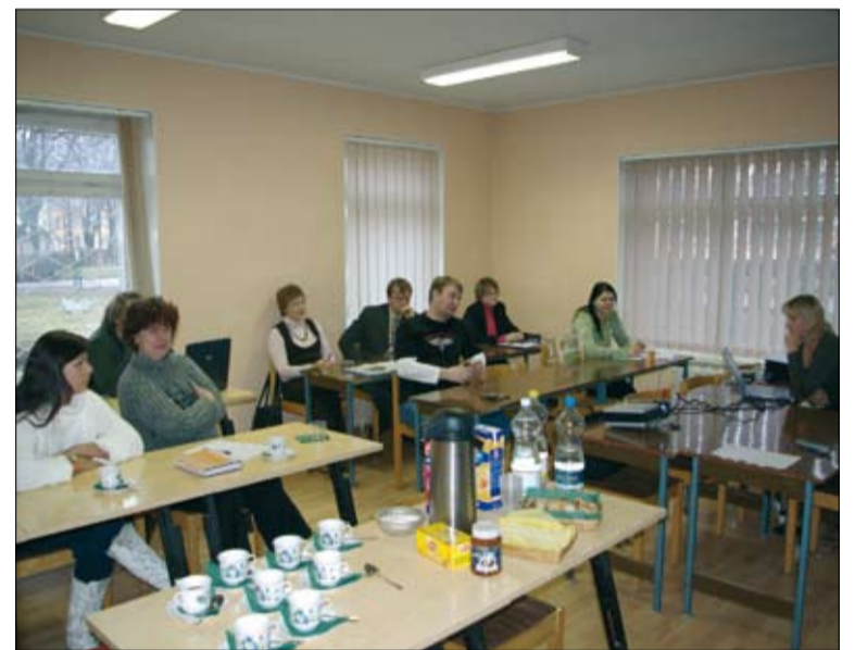
Töörühmade koosolekute ja koolituste käigus joodi ära kümneid liitrit kohvi.

- korras viidastatud valgustatud teid (sh kergliiklusteid) ja tänavaid, häid kommunikatsiooni võimalusi, puhas ja kaunist looduskeskkonda;