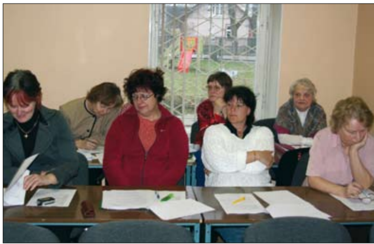
Arenduskoja koolitustel olid valdavalt esindatud naissoo esindajad. See- ga eelmise lk fotol olev küsimus "Kus mehed on?" on igati õigustatud.

Osavõtjate hinnanguid ja soove arvestades on MTÜ Arenduskoda edasistes tegevustes kindel ja tähtis koht nii uutel koolitustel kui ka juba alanud koolituste jätkukursustel. Kavandatud on läbi viia temaatilised projektkirjutamise ja -juhtimise kursused lähtuvalt MTÜ Arenduskoja LEADER strateegia alusel rakenduvatest meetmetest. Jätkukursused toimuvad mainekujundusalasel koolituse